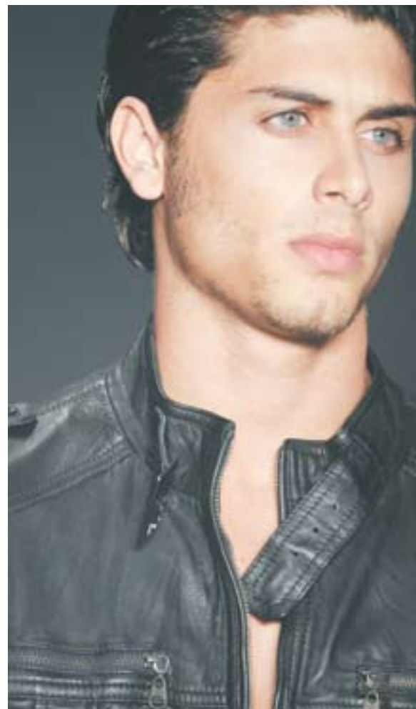
Ellus | SPFW