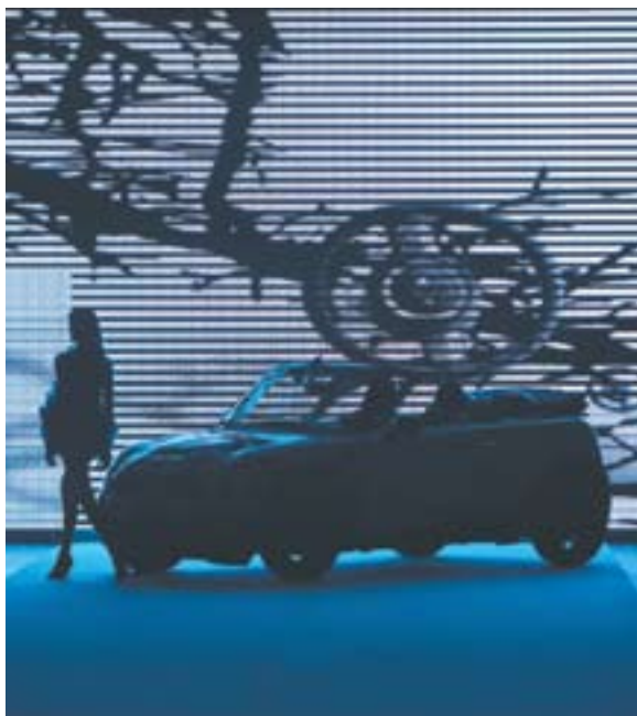
Carlota Joaquina | SPFW

Terminada as semanas de moda, não restam apenas os balanços das tendências, as listas dos melhores e as previsões de negócios. Ficam os acontecimentos que desafiaram expectativas e alteraram padrões. Eles incomodam, mas também corroboram o fato de que a moda é um terreno complexo, com muitos mais veios comunicantes com as inquietações da cultura em geral do que normalmente se pretende.