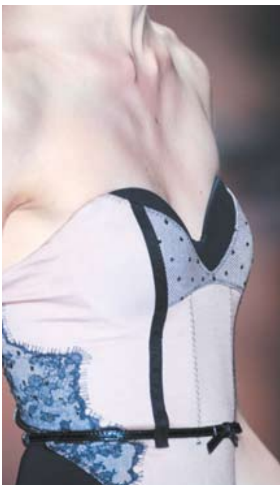
Rosa Chá | SPFW